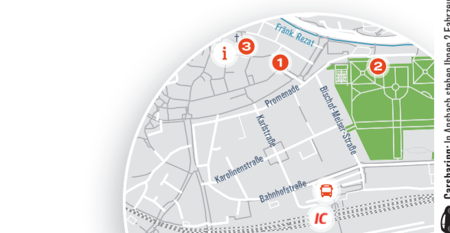
Carsharing: In Ansbach stehen Ihnen 2 Fahrzeuge im näheren Bahnhofsumfeld zur Verfügung.

Erreichbarkeit vom Bahnhof: 9 Minuten → 3