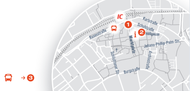
Carsharing: Am Bahnhof Schorndorf steht Ihnen 1 Fahrzeug zur Verfügung.

Erreichbarkeit vom Bahnhof | ZOB: 10 Minuten Linie 242: Schorndorf Bahnhof | ZOB - Haydnstraße