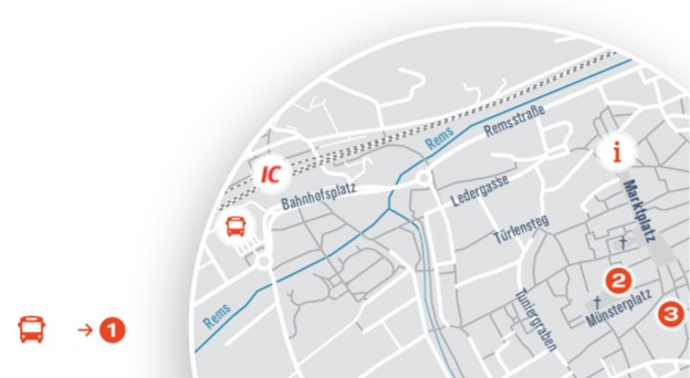
Carsharing: Am Bahnhof Schwäbisch Gmünd stehen Ihnen 2 Fahrzeuge zur Verfügung.

Erreichbarkeit vom Bahnhof: 12 Minuten → 3