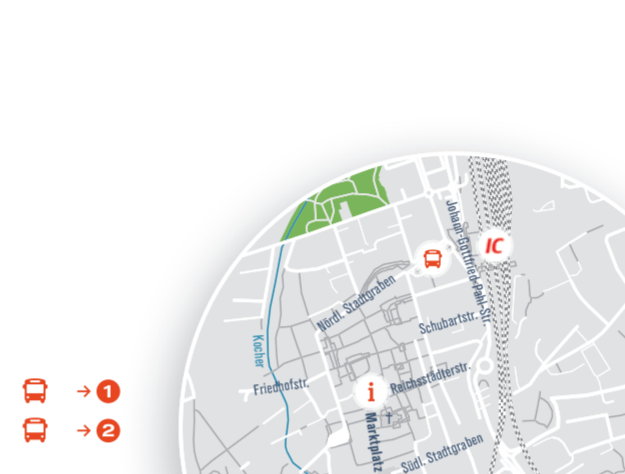
Carsharing: Ab Sommer 2016 steht Ihnen in Aalen 1 Fahrzeug am Bahnhof zur Verfügung.

Erreichbarkeit vom Bahnhof | ZOB: 12 Minuten → 2 Linie 82, 83: Aalen Bahnhof | ZOB - Tiefer Stollen