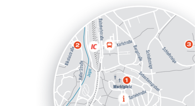
Carsharing: Am Bahnhof Ellwangen steht Ihnen 1 Fahrzeug zur Verfügung.

Erreichbarkeit vom Bahnhof: 15 Minuten → 3