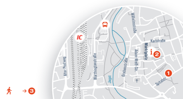
Carsharing: Am Bahnhof Crailsheim steht Ihnen 1 Fahrzeug zur Verfügung.

Erreichbarkeit vom Bahnhof: 10 Minuten → 3