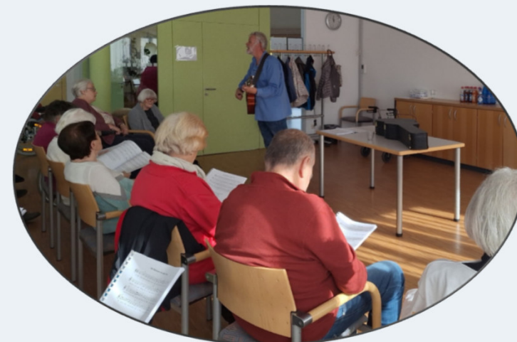
Singkreis für Menschen mit Demenz usw.