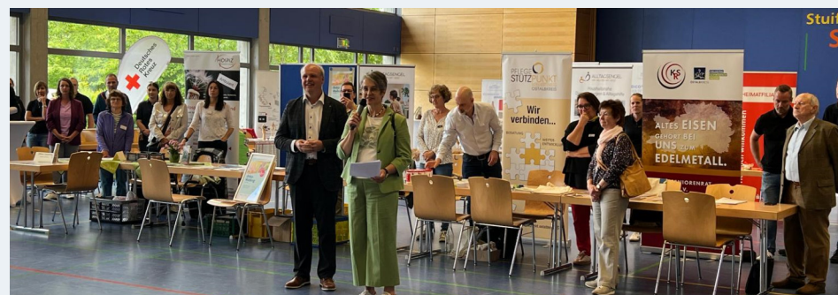
Gesundheits- und Pflegemesse Waldstetten 05.2025