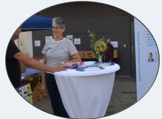
A. Iser, Waldstetter Herbst © Ira Herkommer