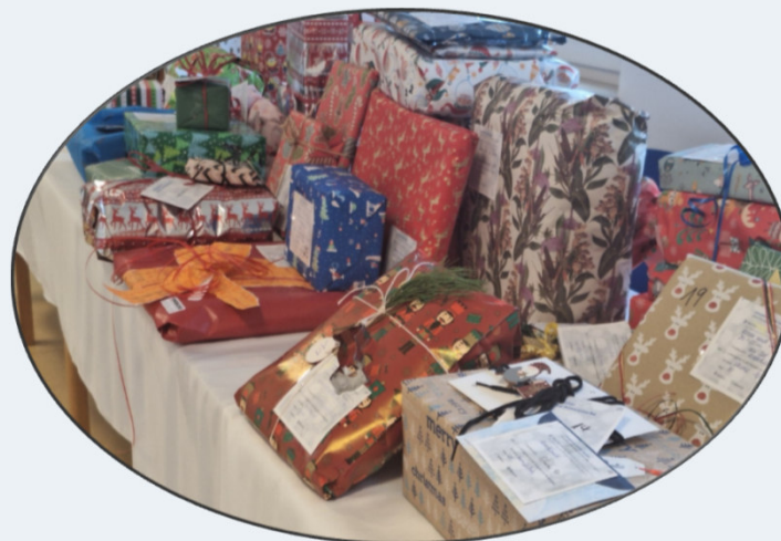
Weihnachtswünsche - Geschenketisch