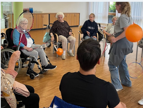
Jugendliche bieten eine Spiel- und Spaß für BewohnerInnen des Seniorenheimes