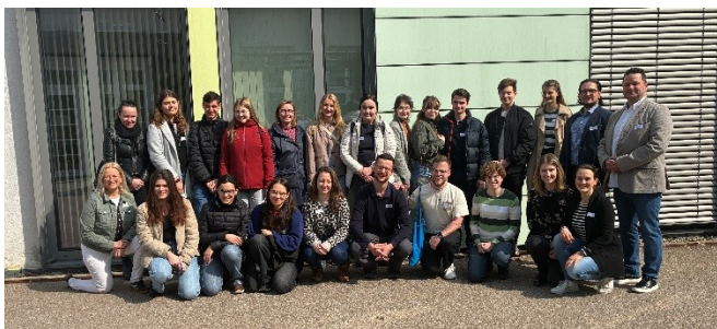
Teilnehmende der Veranstaltung „Medizin im Ostalbkreis erleben“

Der Ostalbkreis setzt sich gemeinsam mit den Ärzteschaften Aalen und Schwäbisch Gmünd sowie den Kliniken Ostalb für die Sicherstellung einer hochwertigen medizinischen Versorgung im Ostalbkreis ein. Dabei liegt ein großer Schwerpunkt in der Nachwuchsförderung und -gewinnung , um junge Medizinerinnen und Mediziner frühzeitig für ein späteres Tätigwerden auf dem Land zu begeistern. Am 21. März 2026 fand im