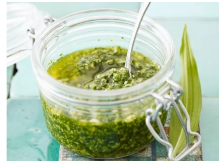
Bärlauch-Pesto im Glas

Von März bis Ende Mai ist endlich wieder Bärlauch-Saison! Das aromatische Wildkraut ist nicht nur eine köstliche Zutat für ein frisches Pesto, sondern auch ein echtes Plus für die Gesundheit. Bärlauch hat ähnliche Vorteile wie Knoblauch oder Zwiebeln, ist dabei jedoch meist leichter verdaulich . Seine Schwefelstoffe und ätherischen Öle können Magen und Darm unterstützen und sich positiv auf die Gefäße sowie auf Gelenke und Knorpel auswirken. Beim Zerkleinern der Blätter wird Allicin freigesetzt, das zur Gefäßerweiterung beitragen und damit den Blutdruck günstig beeinflussen kann. Mit einem hohen Gehalt an Vitamin C (ca. 150 mg pro 100 g und damit drei Viertel der pro Tag empfohlenen Menge) stärkt Bärlauch zudem die Abwehrkräfte und schützt die Zellen vor freien Radikalen. Besonders bemerkenswert ist sein hoher Adenosin Gehalt, der ebenfalls gefäßerweiternd wirkt und bei Durchblutungsstörungen und bei Migräne unterstützend sein kann.