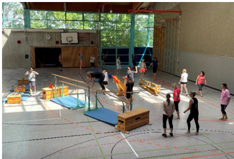
Teilnehmende beim 3. Kongress „Bewegungsförderung im Kindergarten“