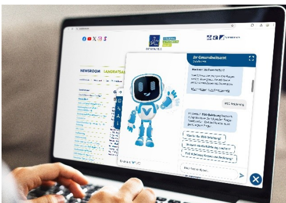
Chatbot Landratsamt Ostalbkreis

Seit Januar 2025 bietet das Gesundheitsamt Ostalbkreis einen neuen digitalen Service: einen Chatbot , der Bürgerinnen und Bürger rund um die Uhr bei Fragen zu Gesundheitsthemen unterstützt. Innerhalb weniger Sekunden erhalten Nutzerinnen und Nutzer Antworten zu häufiggestellten Fragen und wichtige Informationen. Damit ergänzt der Chatbot die bisherigen Kontaktmöglichkeiten per E-Mail, Telefon oder den persönlichen Kontakt und erleichtert den Zugang zu Informationen. Der Hintergrund für die Entwicklung war ein steigender