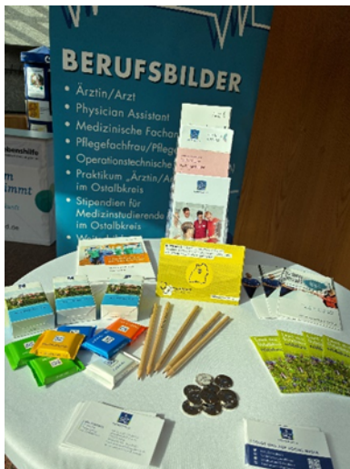
Messestand „Medizinische Versorgung im Ostalbkreis“ auf der Ausbildungs- und Studienmessen in Schwäbisch Gmünd

Im Februar und im März waren Mitarbeiterinnen der Gesundheitsplanung mit dem Stand „Medizinische Versorgung im Ostalbkreis“ an den Ausbildungs- und Studienmessen in Aalen und Schwäbisch Gmünd vertreten. Gemeinsam mit erfahrenen Ärztinnen stand das Team für Fragen rund um das Medizinstudium sowie die Vielfalt der Berufsbilder im medizinischen Bereich zur Verfügung. Ob Physician Assistant, Medizinische/r Fachangestellte/r oder weitere spannende Ausbildungs- und Studienmöglichkeiten – umfassende Informationen wurden bereitgehalten und wertvolle Impulse für die individuelle Karriereplanung gegeben. Auch wurden Interessierte über Fördermöglichkeiten während des Medizinstudiums sowie zu alternativen Zugängen in die Medizin informiert, beispielsweise Studienwege ohne 1,0-Abitur. Insgesamt fand ein lebendiger Austausch mit Schülerinnen und Schülern sowie weiteren Interessierten statt – das große Interesse und die rege Beteiligung wurden als äußerst positiv bewertet.