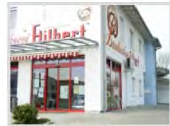
Bäckerei Hilbert, Eschach