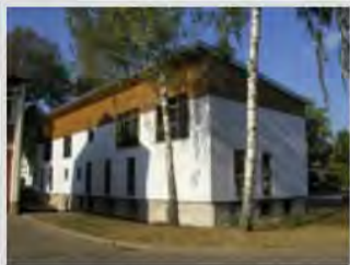
Das neue Dorfhaus nach der Fertigstellung

Mit Unterstützung der ELR-Förderung konnte die Stadt Lorch das ehemalige Wohngebäude nach umfangreichen Baumaßnahmen erneuern und im Oktober 2003 gemeinsam mit der Bürgerschaft einweihen.