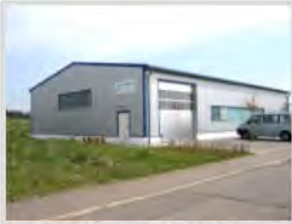
Das Betriebsgebäude der Firma Luther

Seit über 30 Jahren vertreibt die Firma Luther Produkte in den Bereichen Bürobedarf, Klebebänder, Verpackungsbedarf und EDV-Zubehör. Der Betrieb war auf zwei Standorte verteilt, die beide innerhalb eines Wohngebietes lagen. Durch den Neubau im Gewerbegebiet Göggingen-Leinzell boten sich der Firma bessere Entwicklungsmöglichkeiten.