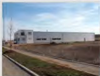
Fa. OMEGA GmbH, Schwäbisch Gmünd

Projekt: Neubau einer Produktionshalle (Rösterei) mit Büro im Gewerbepark Gügling, Schwäbisch Gmünd