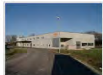
Fa. MHG-Fahrzeugtechnik GmbH, Heubach

Projekt: Neubau eines Betriebsgebäudes im