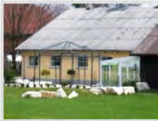
Der große Saal der Scheunen Wirtin

In der ehemaligen landwirtschaftlichen Hofstelle wurde der Viehstall zu einem stilvollen, rustikalen Gastraum umgebaut. In der Scheune wurde bereits seit mehreren Jahren sehr erfolgreich eine Gaststätte betrieben, was den Anstoß zur Erweiterung des Angebots gab. Das Einzugsgebiet der Gäste reicht weit über Bartholomä hinaus, womit dieses außergewöhnliche Gastronomieprojekt auch in touristischer Hinsicht wichtige Impulse setzt. Aus dem Holzbackofen wird regionale und traditionelle Küche geboten. Von Zeit zu Zeit runden Mundart-, Lieder- und Comedy-Abende das Angebot ab. Neben der Sicherung der bestehenden