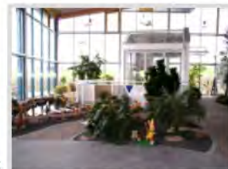
Der Ausstellungsbereich der Fa. HaGe

Projekt: Neubau einer Betriebsstätte im Gewerbegebiet