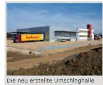
Die neu erstellte Umschlaghalle

Der Schwerpunkt der 1928 in Schwäbisch Gmünd gegründeten Speditionsgesellschaft stellt die Transportabwicklung von Teil- und Komplettladungen dar. Den größten Teil des Sendungsaufkommens wird mit der eigenen Fahrzeugflotte abgedeckt. Der bisherige Standort lag in einer städtischen Gemengelage und konnte nicht erweitert werden. Aus Platznot mussten zahlreiche Fahrzeuge an verschiedenen Standorten in Schwäbisch Gmünd abgestellt werden. Um die künftige Versorgung der Kunden, trotz steigendem Verkehrsaufkommen, flexibel und pünktlich bedienen zu können, musste die Anlieferung an einem zentralen, modernen Umschlagpunkt gebündelt werden. Im Gewerbepark Gügling konnte der Neubau einer Umschlag- und Lagerhalle mit Bürogebäude realisiert werden.