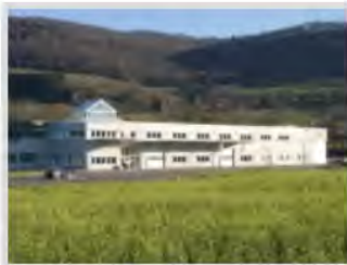
Fa. MHG-Fahrzeugtechnik GmbH, Heubach

Verlagerung der Fa. MHG-Fahrzeugtechnik GmbH von der Gemeinde Böbingen an der Rems. Am neuen Standort fand das Unternehmen notwendige Expansionsmöglichkeiten vor und konnte ein Produktions- und Bürogebäude neu erstellen.