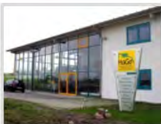
Firma HaGe - Wintergarten- und Metallbau GmbH

Mit der Verlagerung der Firma HaGe-Wintergarten- und Metallbau GmbH in das Gewerbegebiet "Böbingen Süd, 2. Bauabschnitt" erfolgte der Neubau der Betriebsstätte mit Produktionshalle, Büroräumen und Ausstellungsbereich.