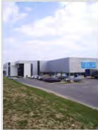
Die Fa. Erhard & Söhne GmbH

Die Firma Erhard & Söhne GmbH ist innovativer Systemlieferanten für Tanksysteme, Lenkungsmodul für Kraftfahr- und Nutzfahrzeuge, funktionale Automobilkomponenten sowie Maschinenverkleidungen und -gehäuse für die allgemeine Industrie.