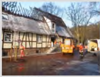
Das ehemalige Dorfgemeinschaftshaus nach dem Brand

Projekt: Dorfgemeinschaftshaus Lorch-Waldhausen ELR-Programmjahr: 2002 Förderschwerpunkt: Gemeinschaftseinrichtungen Gesamtinvestition: 720.000 EUR