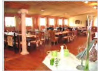
... der große Saal von innen

Arbeitsplätze konnten zusätzliche neue Arbeitsplätze geschaffen werden.