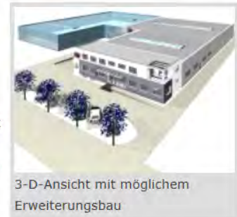
3-D-Ansicht mit möglichem Erweiterungsbau

Die bisherige Betriebsstätte im Stadtgebiet war sehr beengt - teilweise mussten Lagerflächen an anderen Standorten angemietet werden. Um auch zukünftig das Unternehmen mit Erfolg weiterzuführen zu können, war der Neubau einer Produktions- und Lagerhalle mit angegliedertem Büro dringend erforderlich. Ein geeignetes Grundstück konnte im Gewerbepark Gügling erworben werden. Die Verlagerung aus der innerörtlichen Gemengelage war auch aus städtischer Sicht wünschenswert, um künftige Störungen mit der umliegenden Wohnbebauung sowie einer Grund- und Hauptschule in unmittelbarer Nähe zu vermeiden.