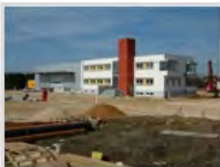
Lakner Spedition + Logistik, Schwäbisch Gmünd - mit dem Bürogebäude im Vordergrund

Projekt: Verlagerung durch Neubau einer Halle im Gewerbepark Gügling, Schwäbisch Gmünd