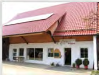
Fa. Klavier Wagner in Eschach

Für die 1991 gegründete Firma Klavier Wagner bot sich im leerstehenden Viehstall des Hofes in Eschach die Möglichkeit, die notwendig gewordene Betriebserweiterung mit Vergrößerung der Ausstellungs- und Verkaufsfläche umzusetzen.