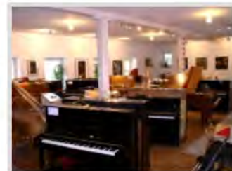
... die Räume von innen

Projekt: Umnutzung eines ehemaligen landwirtschaftlichen Gebäudes zum Verkaufs- und