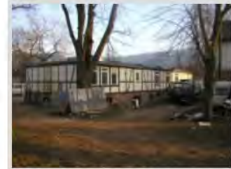
Bis auf die Grundmauern wurde das gesamte Gebäude abgebrochen

Fertigstellung ist es am 14.12.2001 einem Brand zum Opfer gefallen. Das komplette Dachgeschoss wurde zerstört und auch das Erd- und Untergeschoss war kompett sanierungsbedürftig.