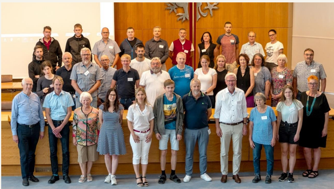
Abbildung 1: Mitglieder des Bürgerforums Zukunftskonzept Kliniken Ostalb

Im September 2023 werden die Resultate des Bürgerforums offiziell an den Kreistag übergeben. Nach der Vorfestlegung am 25.07.2023 auf das Modell des Regionalversorgers entwickelt der Vorstand der Kliniken Ostalb gemeinsam mit dem Kreistag und dem Verwaltungsrat die Feinkonzeption. Die Ergebnisse des Bürgerforums dienen hierbei als Beratung. Ende des Jahres 2023 wird der Fahrplan für die zukünftige Gesundheitsversorgung im Ostalbkreis vorgestellt.