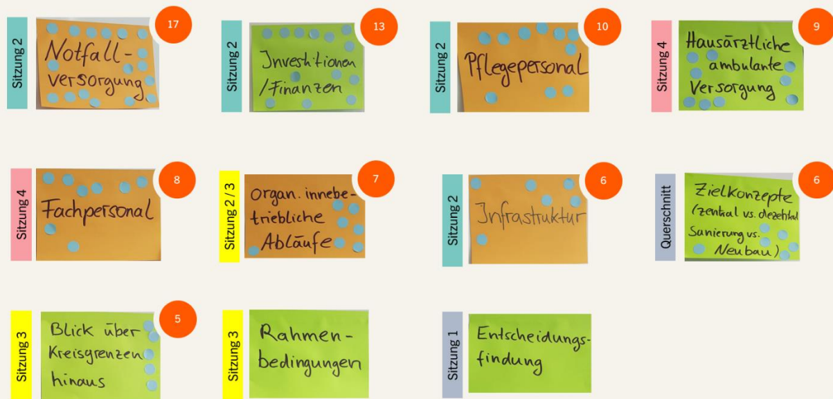
Abbildung 3: Diskussions-Themen des Bürgerforums sortiert nach Priorität.

Im Ergebnis identifizierten die Mitglieder der Bürgerforums 11 Themen, die sie priorisiert diskutieren wollten (siehe Abbildung 3).