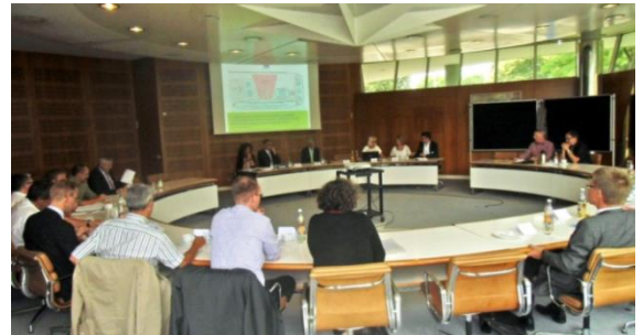
Foto: Sitzung der Steuergruppe

Die Steuergruppe trägt die Gesamtverantwortung für die Entwicklung der Bildungsregion Ostalb. Sie entwickelt Leitbilder sowie Ziele für die Bildungsregion und initiiert deren strategische Umsetzung. Gleichzeitig verantwortet sie den Aufbau von Netzwerken und den Einsatz von Ressourcen, die für die Umsetzung der Ziele in der Bildungsregion notwendig sind.